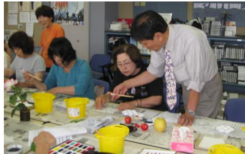
研修会で絵手紙の指導