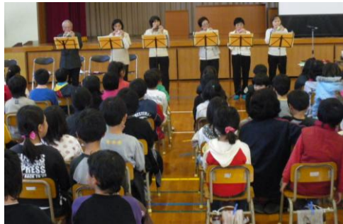
音楽鑑賞会でオカリナを聴く子ども達