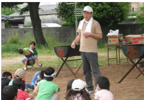
子ども会でのレクリエーション指導