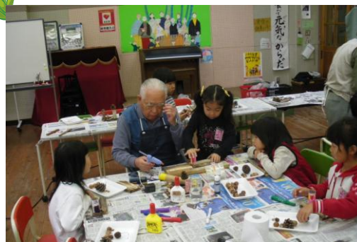
小学校の授業で木工指導

生涯学習まちづくり推進本部では、元気いっぱい笑顔があふれる社会を目指して「生涯学習ボランティア登録派遣事業(愛称・まなばんかん)」を行っています。登録されたボランティアさんが地域や施設、学校などで実施する行事に出演または講義をしている様子を紹介します。