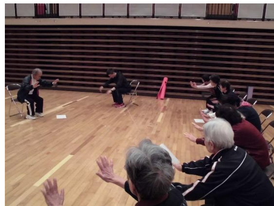
〔筋力トレーニング〕