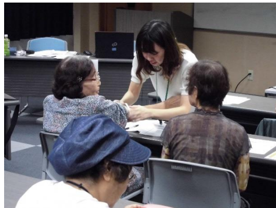
〔簡易栄養状態評価〕