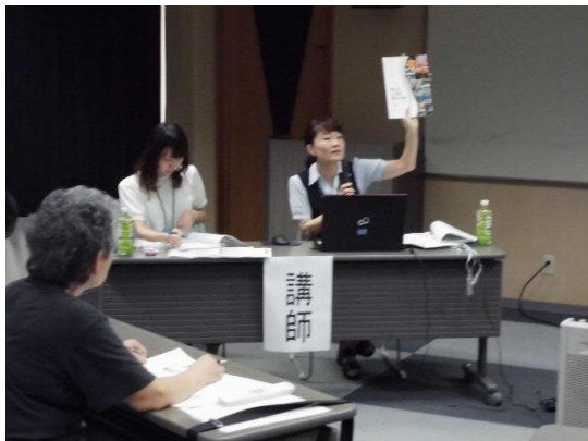
〔健康管理・栄養管理講座〕

栄養管理講座では、管理栄養士が「低栄養について」「低栄養を防ぐ食事のポイント」「献立の立て方などについて」の講座、簡易栄養状態評価表で栄養状態のチェックなどを行った。