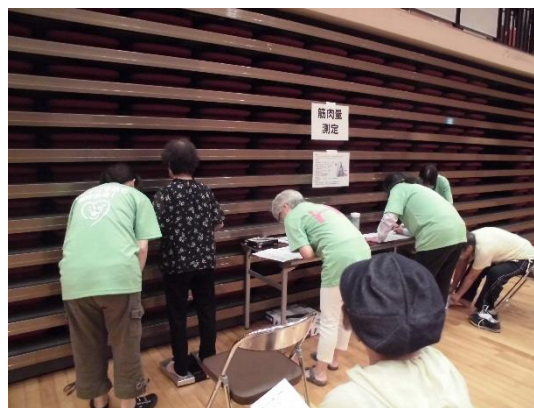
〔体力測定会（フレイルチェック）〕