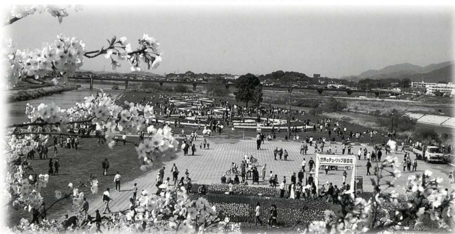
のおがたチューリップフェア 花と緑があふれるまち・直方