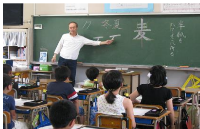
●学習ボランティア