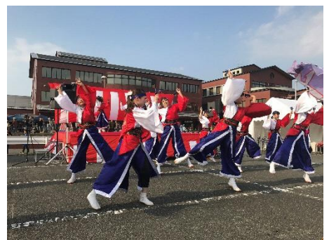
(ステージ発表の様子)

また、発表を見た方からは、「文化祭に出ていたあの団体に参加したい！」とお問い合わせをいただくことも多く、文化祭をとおして今後も文化の輪が広がっていければと考えています。