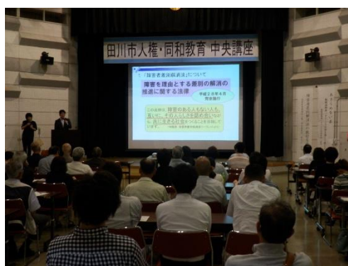
《写真1：田川市人権・同和教育中央講座》

この講座は、地域等と十分な連携の下、校区の課題や要望と行政の主体性を重ね合わせて、講座内容や講師の設定を行い、住民が居住している最寄りの施設（中学校区及び自治公民館単位）において実施しています。