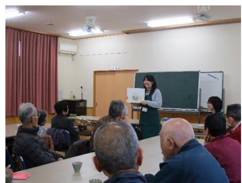
【写真：出前講座の様子】