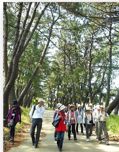
わかばの黒崎宿をさぐる 2018年5月

お問合せ 北九州市立南丘市民センター 北九州市小倉北区鯉谷1-26-15 TEL&FAX 093(582)7328