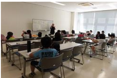
●放課後子ども教室推進事業