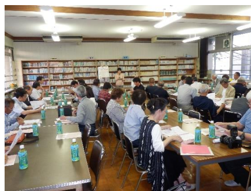
《写真2：校区人権・同和教育講座》