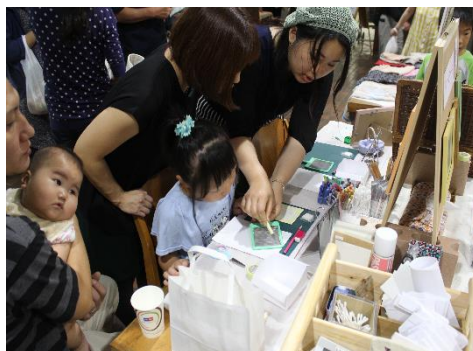
【マルシェ当日 1Fロビー】の様子