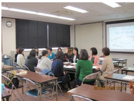
【おうち起業応援セミナー】の様子