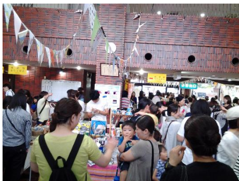
【同日 1Fロビー】の様子