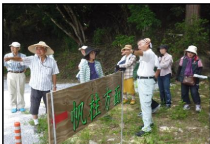
【写真3：「伊良原ダムをのぞいてみよう」】