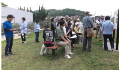
【写真1：第1回「ふるさと行橋史跡めぐり」】

市民学芸員の会ができて12年が経過し新しい会員、それも現役世代の会員が集まりにくく、高齢化が進んでいる。また、案内が広範囲になってきたことで、行き届いた清掃、整備に限界がある。