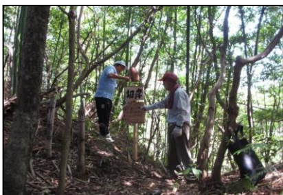
【写真5：馬ヶ岳城の清掃・整備】