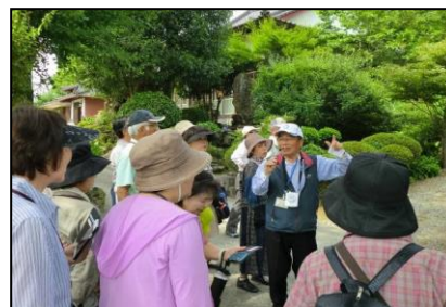
【写真6：市民大学「歴史ロマン探訪講座」案内】