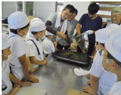
【ふるさと学習「八女のお茶」学習支援】

また、地域学校協働活動の目的でもある学校・地域共に互惠関係を生み出す取組にも積極的である。地域公民館活動への地区内の小学生・中学生の参加を高める仕掛けを心がけ、企画・実践につなげられている。