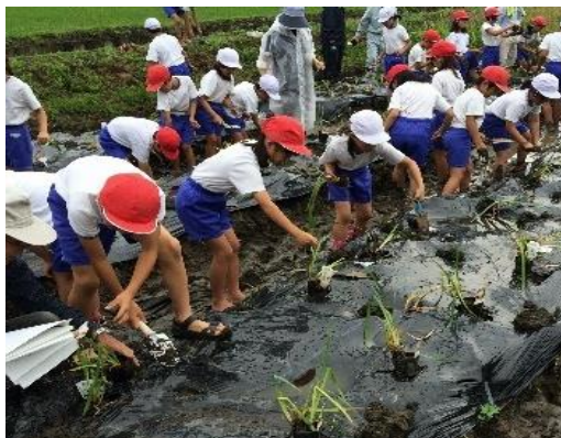
【子ども達への菖蒲苗の植栽支援】

学校と校区の接点を作るためには、それぞれの想いや願いを聞き取ることが重要である。そのパイプ役としての推進員への期待は大きい。学校や地域の課題を収集し、学校教育だけでなく生涯学習が息づく地域づくりに貢献して頂きたいと考える。