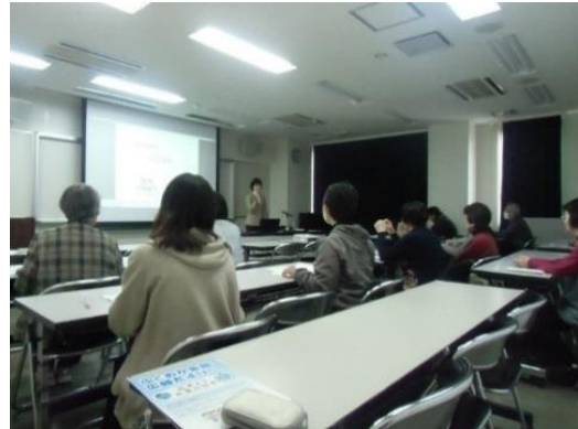
令和元年度 終活講座の様子

人生の最終章を迎えるにあたり、自分自身の思いや希望を確実に家族などに伝えるためのノート