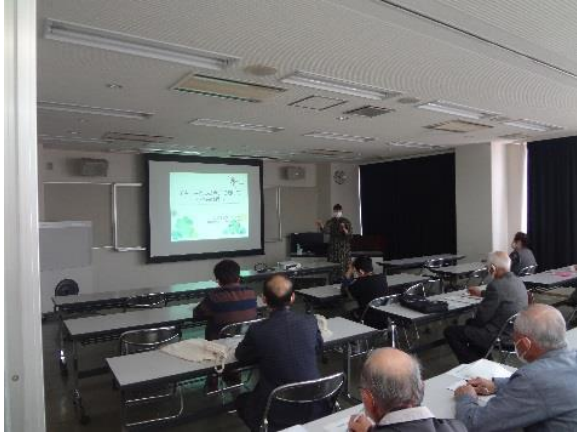
令和2年度 終活講座の様子

葬式について宗派による作法の違い、葬儀の流れ、葬儀に係る経費、遺影の選び方等の葬儀に関する豆知識について講習を行った。