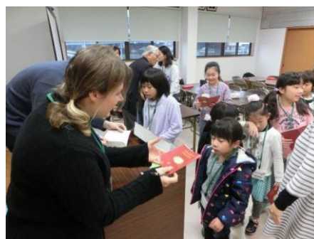
〔みずまきパスポート〕

外国人講師と寝食を共にし、日常生活の中で外国語を使いこなす体験を目的とする。英語のみならず、多言語・多文化に触れさせることがサマー・スクールとの相違点のひとつである。各外国人講師を担任とし、子ども4～5人の少人数グループを設定する。各グループ内での自由なおしゃべり、食事、身の回りの片付け等の生活活動を通して、子どもたちが日本との文化や習慣の違いに直に触れ、自分なりの新たな発見が出来るよう見守る。