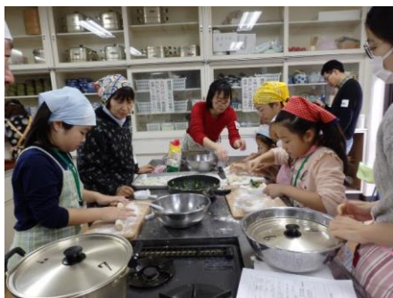
〔春節（餃子）パーティ〕

旧正月を祝う中国の春節に合わせ、中国人講師及び中国人留学生らと行う餃子作り。調理や食事を通し、簡単な中国語の習得、中国文化の理解及びさらなる中国語学習への意欲を促すことを目的とする。