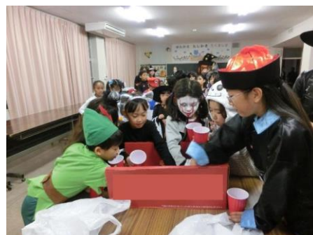
〔トリック・オア・トリート〕