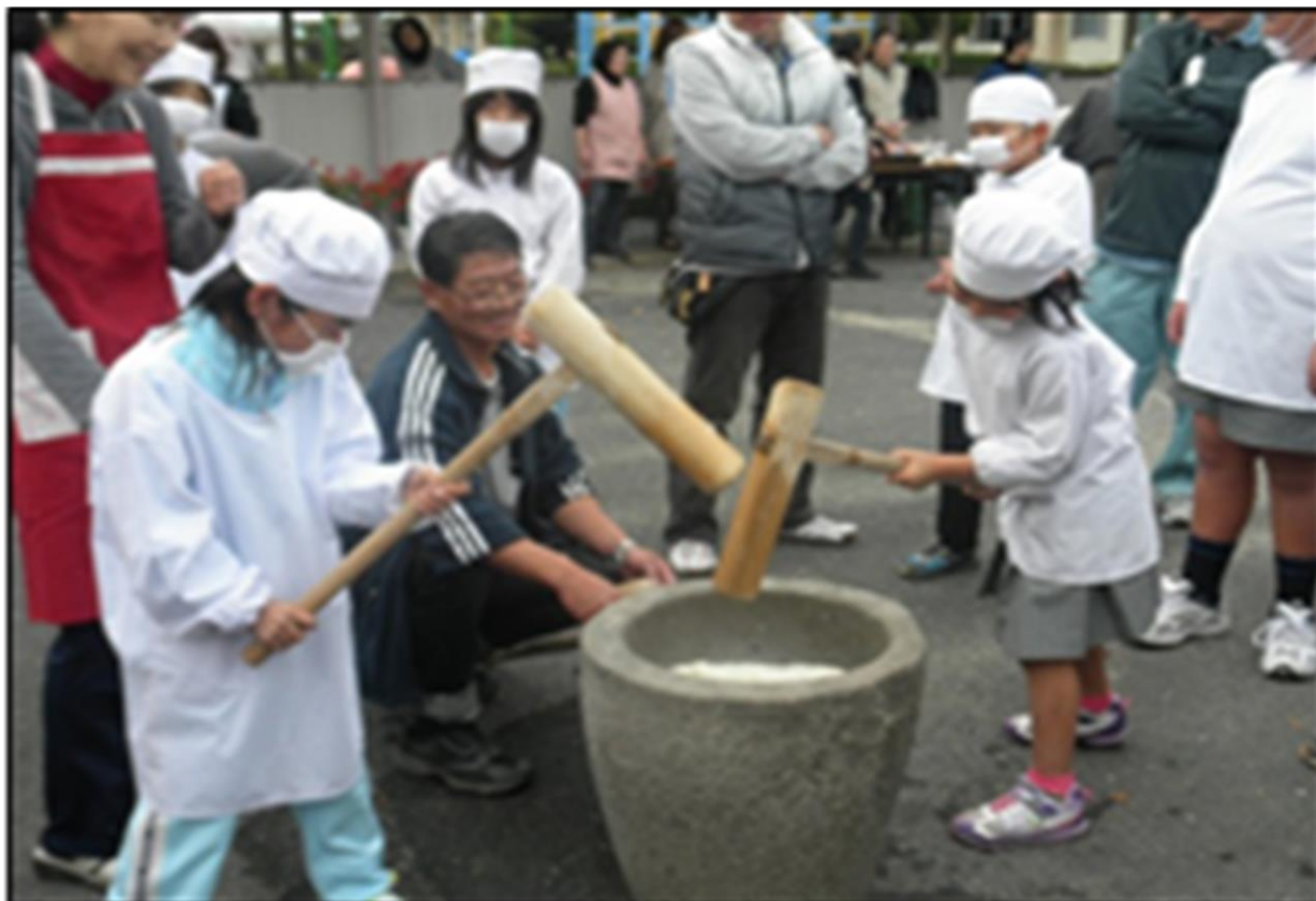
船越文化祭・もちつき大会：久留米市船越校区コミュニティセンター