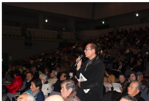
実践発表会場の様子