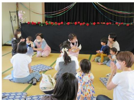
親子読み聞かせ教室