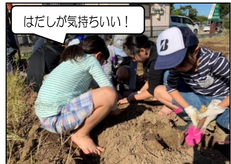
【写真1 芋ほりの様子】

善導寺も高齢化が進んでおり、活動の準備や後片付けが大変なことに加え、後継者不足の問題もあります。しかし、将来を担う子どもたちのためにも、保護者のみなさんのためにも、地域のみなさんと協力して少しでも役に立つ活動をこれからも実施していきたいと考えています。