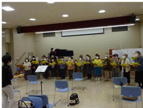
文化ボランティア養成講座わかしお(歌唱コース)

岡垣町は中央・東部・西部の3公民館を有しており、中央公民館を中心に多様な教室や講座を開催しています。乳幼児と保護者を対象とした「親子読み聞かせ教室」や、小中学生と保護者を対象とした「ふれあいチャレンジ教室」、16歳以上の方を対象とした「ライフスタイル講座」など、子どもから大人まで全ての年代に学びの機会を提供しています。