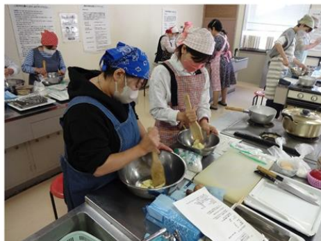
ライフスタイル講座(料理教室:焼き菓子づくり)