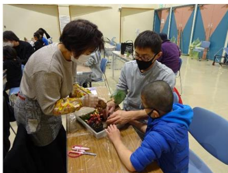
ふれあいチャレンジ教室(こけ玉づくり)