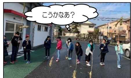
【写真2 もぐら打ちの様子】

【問合せ先】 善導寺コミュニティセンター 〒 839-0824 久留米市善導寺町飯田 424-1 TEL 0942-47-1065 FAX 0942-47-1663